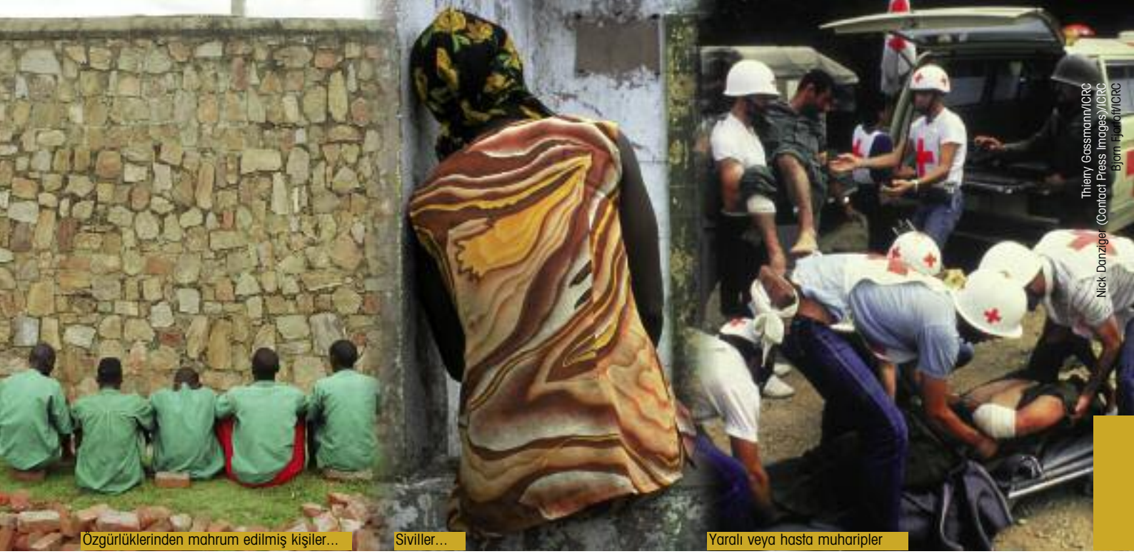
Özgürlüklerinden mahrum edilmiş kişiler...