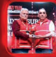
2024 Yılı Nüfusa Oranlı En fazla Gönüllü Kazanımı Yapan İççe Ödülü Akdağmadeni İççe Şube