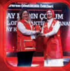
Gonulluol.org'u En Etkin Kullanan Kızıllay Kadın Topluluğu Ödülü Kızıllay Kadın Çorum