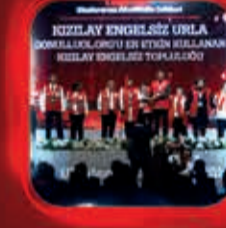
Gonulluol.org'u En Etkin Kullanan Kızıllay Engelsiz Topluluğu Ödülü Urfa Şubesi