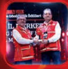
Gonulluol.org'u En Etkin Kullanan Kızıllay İl Şubesi Ödülü Hatay İl Merkezi