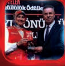
Kızılay-Kızıllaç Kırmızı Aile Ödülü Filistin Kızılları Gönüllüleri