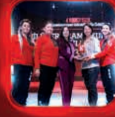
Afetin Gönüllüsü Ödülü NAK Arama Kurtarma Gönüllüleri