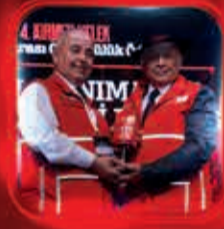
Sivil Toplum Gönüllüsü Ödülü Engel Tanımayan Diş Hekimliği Derneği