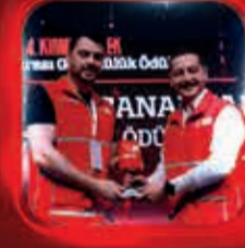
Gonulluol.org'u En Etkin Kullanan Genç Kızıllay Topluluğu Ödülü Genç Kızıllay Çanakkale