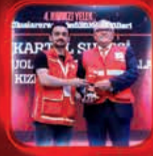
Gonulluol.org'u En Etkin Kullanan Kızıllay İççe Şubesi Ödülü Kartal Şubesi