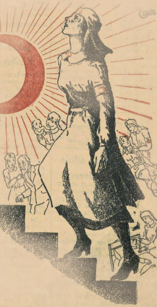
60 ıncı yıldönümünü (23 birincikânun 1937) de kutlamak bahtıyarlığına hazırlanan Kızılay, uzun ve şerefli mazisindeki yüksek azmi, kudreti ve heyecanile, üzerine aldığı insanî vazifelerini, her an daha artan bir gayretle başarmaya çalışıyor